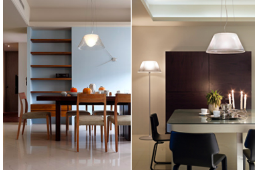
左圖：逝去數字的时间，让生活不需如此斤斤计较(天母吉園住家案)。

生命是一道萃煉的歷程，去蕪存菁之後，留下的才是最最寶貴的部分。極簡設計想說的無非就是如此。