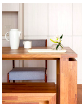
愈是簡單，愈是雋永，愈是咀嚼有味(蝶舞行館住家案)。

「極簡」是一種還原的過程。歷經化繁為簡的過程後，所驗證與萃取出的，是人類共同語言，跨越了種族與文化的藩籬，所有的人們都可理解與體會，不再須要額外解釋的真諦。