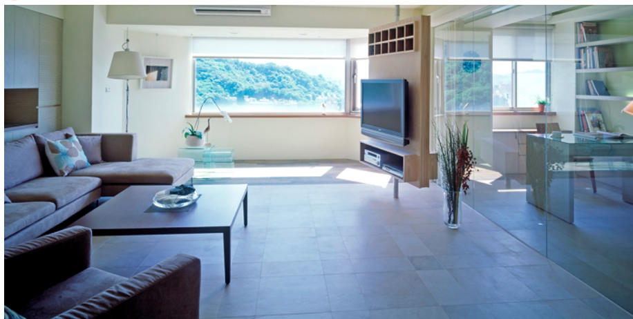
維持高度的穿透感，以對應內在的心靈活動(王者鄉住家案)。